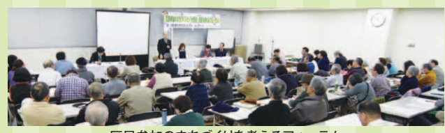
区民参加のまちづくりを考えるフォーラム